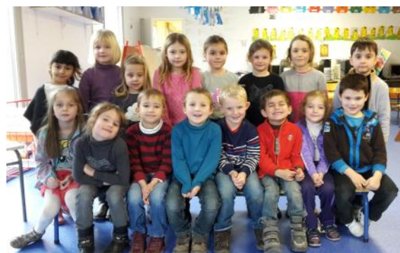
Le groupe des grands le 27 janvier