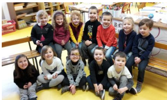
Le groupe des moyens le 27 janvier