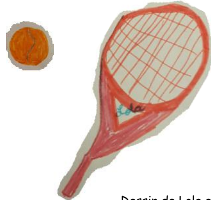
Dessin de Lola et Tom