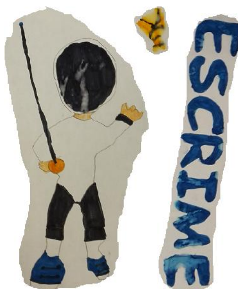
Dessin de Léane

Oui, je fais cela tous les jours en club. Principalement au cercle de l'escrime. Je fais également les NAP à Cormicy et Saint-Thierry.