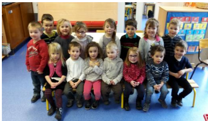
Le groupe des petits le 27 janvier

Les activités sont différentes de celles de l'école mais parfois les tout petits ne se rendent pas tout à fait compte que ce n'est pas l'école. Au début, ils se demandaient où était la maîtresse mais maintenant ils savent que le mardi c'est différent et que nous sommes seules avec eux.