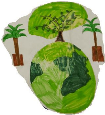
Dessin de Ninon